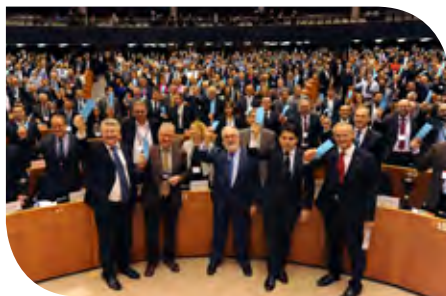
Dirigeants et maires européens approuvent symboliquement les objectifs de la Convention des Maires pour le climat et l'énergie au Parlement européen en 2015.

Commissaire européen chargé de l'action pour le climat et de l'énergie