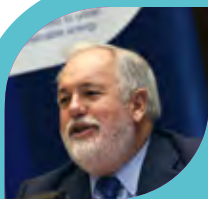
Miguel Arias Cañete

Elles s'engagent à développer des Plans d'Action en faveur de l'Energie Durable et du Climat pour 2030 et à mettre en œuvre des actions locales d'atténuation du changement climatique et d'adaptation .